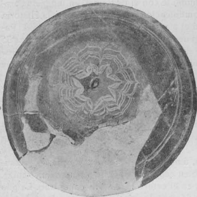
Plato de vidrio hallado en las excavaciones del Monasterio Leyulense, de color verdoso y dibujo blanco grabado a la rueda. Diámetro 185 mm. altura 50