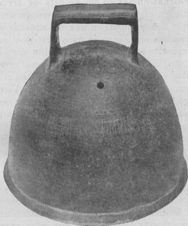
La famosa campana mozárabe del Abad Sansón, una de las más antiguas de la cristiandad, hallada en la sierra de Córdoba, que tiene la siguiente inscripción en latín: «Sansón Abad ofrece este don al templo de San Sebastián mártir de Cristo. Era DCCCCXIII (año 875)». Diámetro 20 cms., altura 19.

do blanco de indudable filiación califal. Acaso la actual huerta del Minguiente fuera la iglesia, y su vaguada el lugar donde los monjes salían a pescar su parvo sustento. La inundación de gran parte de estos terrenos por las aguas represadas del Pantano ha modificado mucho la configuración del paisaje de estos lugares, y acaso enterrado la mansión o alcazaba (frontera al monasterio de San Zoilo) llamada Mancil Hani, donde los ejércitos califales rendían su primera jornada, y de tanto interés histórico por haber sido en ella donde murió Al-mudáfar, el primer hijo de Almanzor, y asesinado el segundo, el torpe Sanchuelo, cuyos sucesos fueron los iniciales del derrumbamiento del Califato. No encontramos en ninguno de aquellos lugares, especialmente en Los Conventillos, que están por cima de la huerta Minguiente, motivo alguno de excavación.