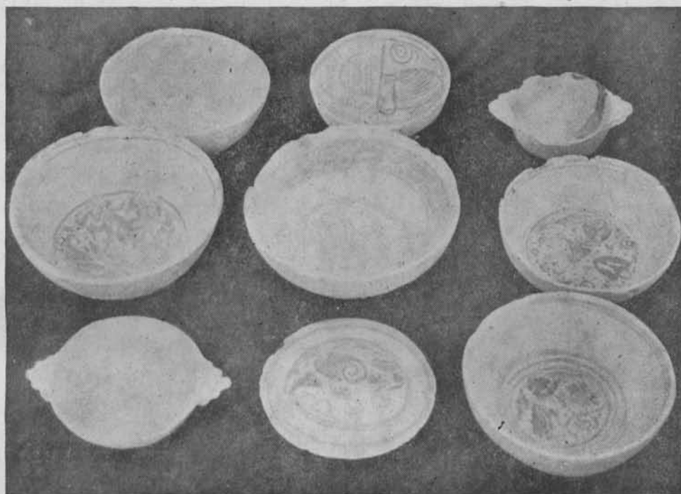
Tipo de cerámicas halladas en «La Alcaidía», posible lugar de monasterio mozárabe. Fondo blanco y dibujos azules, tipo Paterna, fechables en siglo XIV. Diámetro del plato central, 190 mm.

zado en ella, a no ser el mismo Tabanense por algunos autores, en razón a la gran cantidad de restos constructivos que existen inmediatos a la misma casa de la finca. Esta casa, que se divisa desde Córdoba, hacia nordeste, en el mismo alcor de la Sierra, ocupa un emplazamiento muy estratégico, sobre el antiguo camiuo que parte de Rabanales (campamento de los ejércitos califales) y ascendiendo por la cañada de la Víbora pasa por dicha casa y conduce al campamen-